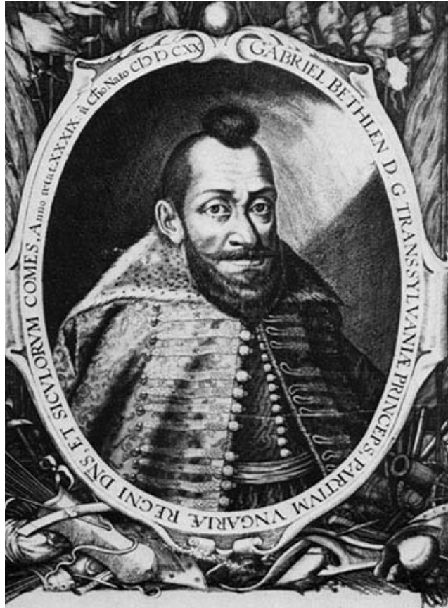
2. Kupferstich von Egidius Sadeler II. (1570-1629) aus dem Jahr 1620.